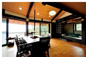
古民家風の絶景リビング